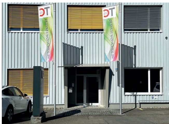
Der Parkplatz - das Corpus Delicti.