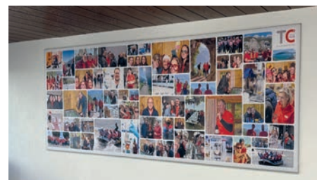
Ambiente und persönliche Note im Besprechungsraum

Die Geschichte ist schnell erklärt und alles dreht sich um die Aufmerksamkeit und den ersten Eindruck.